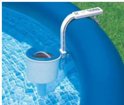
Fotografija je islustrativne prirode, može se razlikovati od stvarnog izgleda.