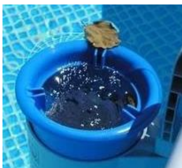
Fotografija je islustrativne prirode, može se razlikovati od stvarnog izgleda.

Skimmer se koristi za uklanjanje krupnije nečistoće sa površine vode u bazenu.