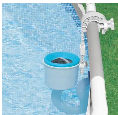
Fotografija je islustrativne prirode, može se razlikovati od stvarnog izgleda.