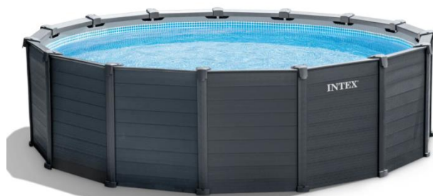
Fotografija je islustrativne prirode, može se razlikovati od stvarnog izgleda.